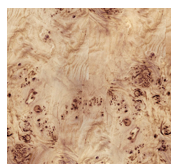
Radica 10 natural