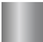
cromo / chrome

Gambe in finitura galvanica / legs in galvanic finish